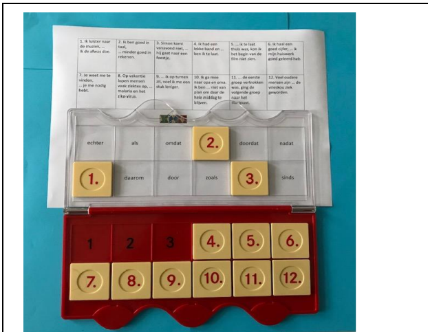
Begin bij 1. Pak het kaartje, lees de opdracht. Wat is het antwoord? Leg het kaartje op het doorzichtige gedeelte op het antwoord. Pak kaartje 2 enz.