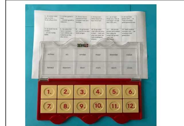
Leg het opdrachtenblad onder het doorzichtige gedeelte: de onderste vakjes van het blad passen er precies onder.