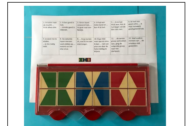
Even checken en klaar! Heb je een foutje, verbeter hem dan.