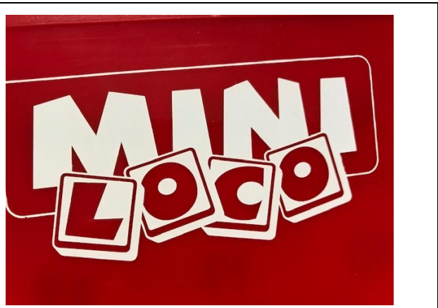
Zo werkt Mini Loco...