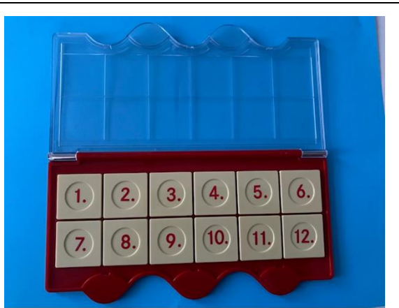
Doe het doosje open. Leg de kaartjes met cijfers 1 -12 op de cijfers in het doosje.