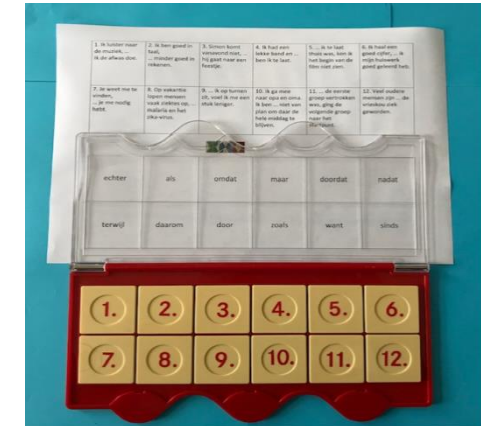
Leg het opdrachtenblad onder het doorzichtige gedeelte: de onderste vakjes van het blad passen er precies onder.