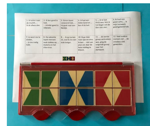
Even checken en klaar! Heb je een foutje, verbeter hem dan.