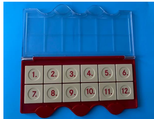
Doe het doosje open. Leg de kaartjes met cijfers 1 -12 op de cijfers in het doosje.