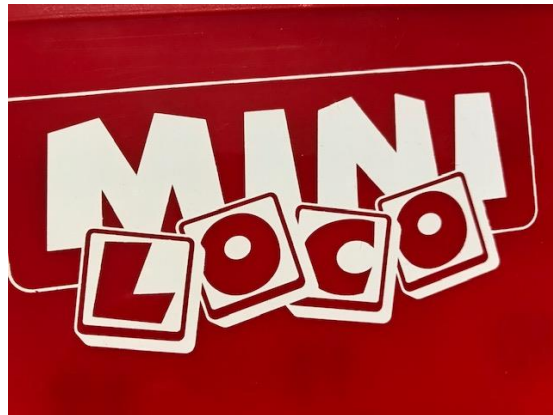
Zo werkt Mini Loco...