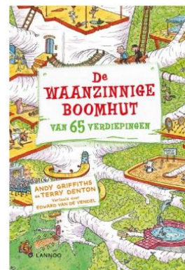
10. Dit is een .....

Dat was te verwachten: Het nieuwste boek van De Waanzinnige Boomhut was binnen één dag door zowel mijn oudste zoon (bijna 12 jaar) als mijn jongste zoon van 9 jaar uitgelezen. Ditmaal niet ná elkaar, maar steeds door elkaar heen. De jongste begon, maar omdat hij ziek is, moest hij halverwege de ochtend een uurtje gaan slapen, zodat de oudste kon beginnen met lezen. Toen de jongste wakker werd, zaten ze samen in het boek te bladeren en te lachen om de tekeningen en de dingen die ze in de verhalen allebei leuk vonden.