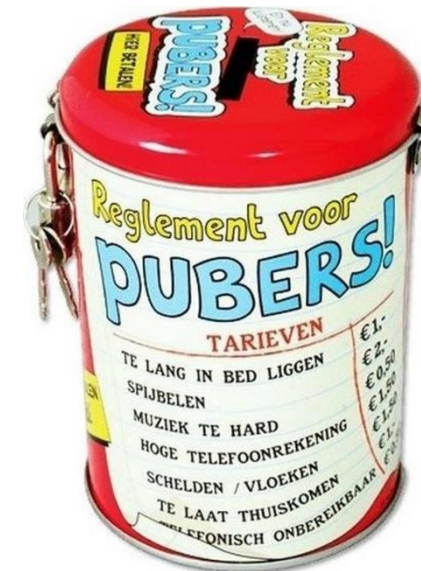
9. Dit is een .....

De waanzinnige boomhut van Andy en Terry heeft nu 65 verdiepingen! Hij is uitgebreid met een dierenriksalon, een verjaardagskamer waarin het altijd jouw verjaardag is (ook al is het dat niet), een ruimte vol met ontplofende oogbollen, een lollyshop, een drijfzandbak, een mierenboerderij, een tijdmachine, en WaanCNN: een tv-zender die je 24 uur per dag op de hoogste houdt van de laatste boomhutnieuwsberichten, de laatste plannen en de laatste roddels. Dus waar wacht je nog op? Kom naar boven!