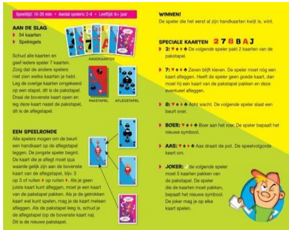
7. Dit zijn .....