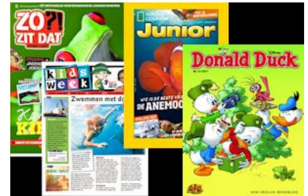
12. Dit zijn .....