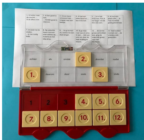
Begin bij 1. Pak het kaartje, lees de opdracht. Wat is het antwoord? Leg het kaartje op het doorzichtige gedeelte op het antwoord. Pak kaartje 2 enz.